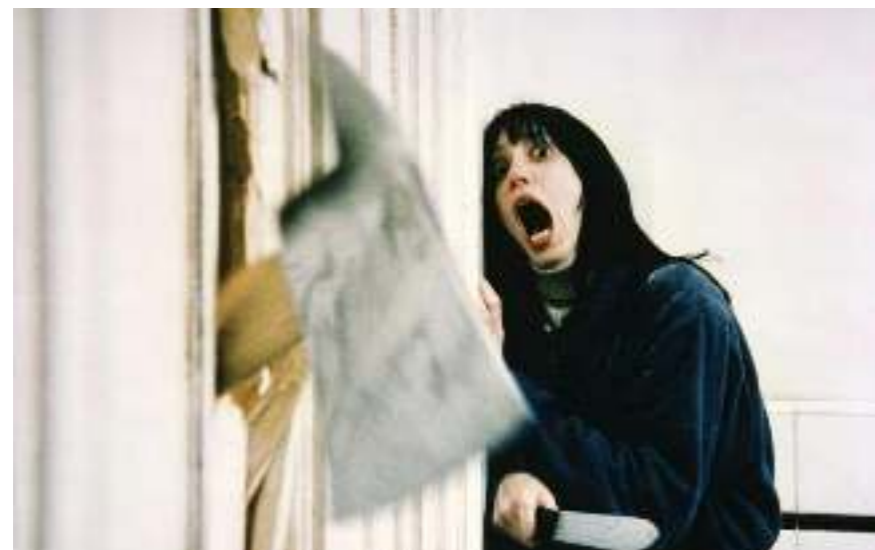
Empatiaa tarvitaan, jotta katsoja pystyy samastumaan päähenkilön piinaan.