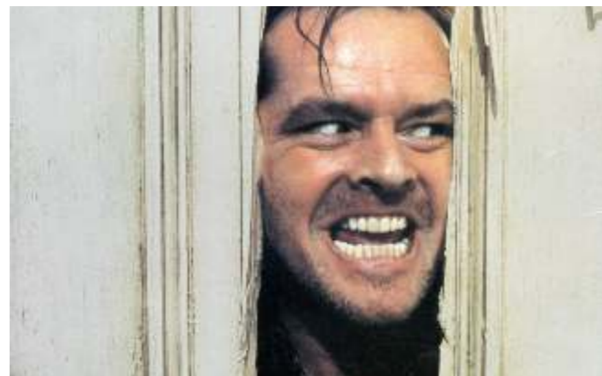
Vuonna 1980-luvulla ensi-iltansa saanut Hohto on yksi kauhuelokuvien klassikoista.