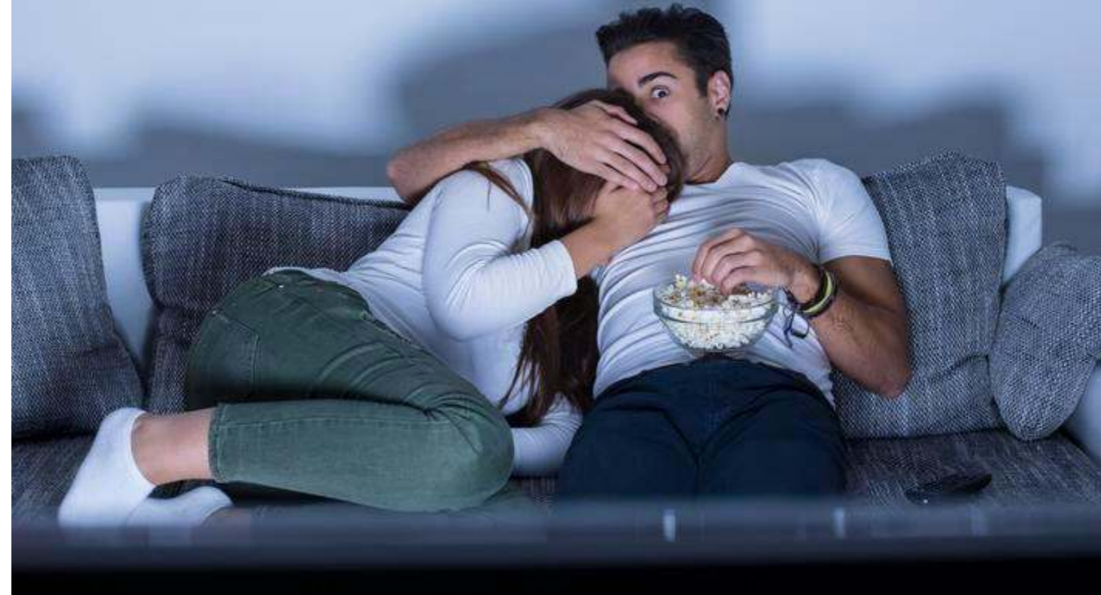
Jaettu pelko on moninkertainen ilo. Kauhuelokuva voi toimia yhteensitovana extreme-kokemuksena.

Kauhuelokuvien avulla voimme pohdiskella myös kuolemaa, haavoittuvuutta, oikeudenmukaisuutta ja inhimillisyyttä. Clasen kirjoittaa teoksessaan Why horror seduces , että kauhufiktio on enemmän kuin pelkkää viihdettä: se on väline, jolla tehdä maailmasta ymmärrettävämpi.